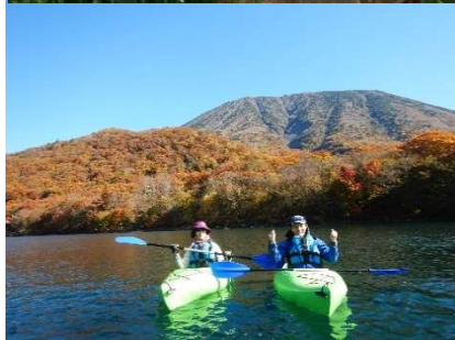
(写真は中禅寺湖にて)

昨年度から理事に就任しましたが、zoom会議が1回とホームカミングデーへの出席でした。今の職場（高校）にも同窓生がいますので神奈川県支部へ勧誘しているところです。柔道部のOB会（獅柔会）主催の春休み合同練習会に（大学道場）出席しました。畑の方は現在の場所が50坪ほどだったのですが、もう1ヶ所50坪ほど増えました。トマトやイモ類を中心に育てています。トマトだけでも130苗植えましたので、収穫期にはマルシェに出そうかと思っています。近況は、コロナ下の約2年間で全国にカヤックをやりに行ってます。海ではカヤックなら洞窟などに入れるので違った楽しみがありますね。5月27日には今年度の理事会が開催される予定です。