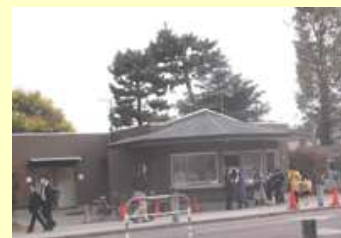
今年の小金井祭では入構を制限し、来場者には事前登録してもらいました。