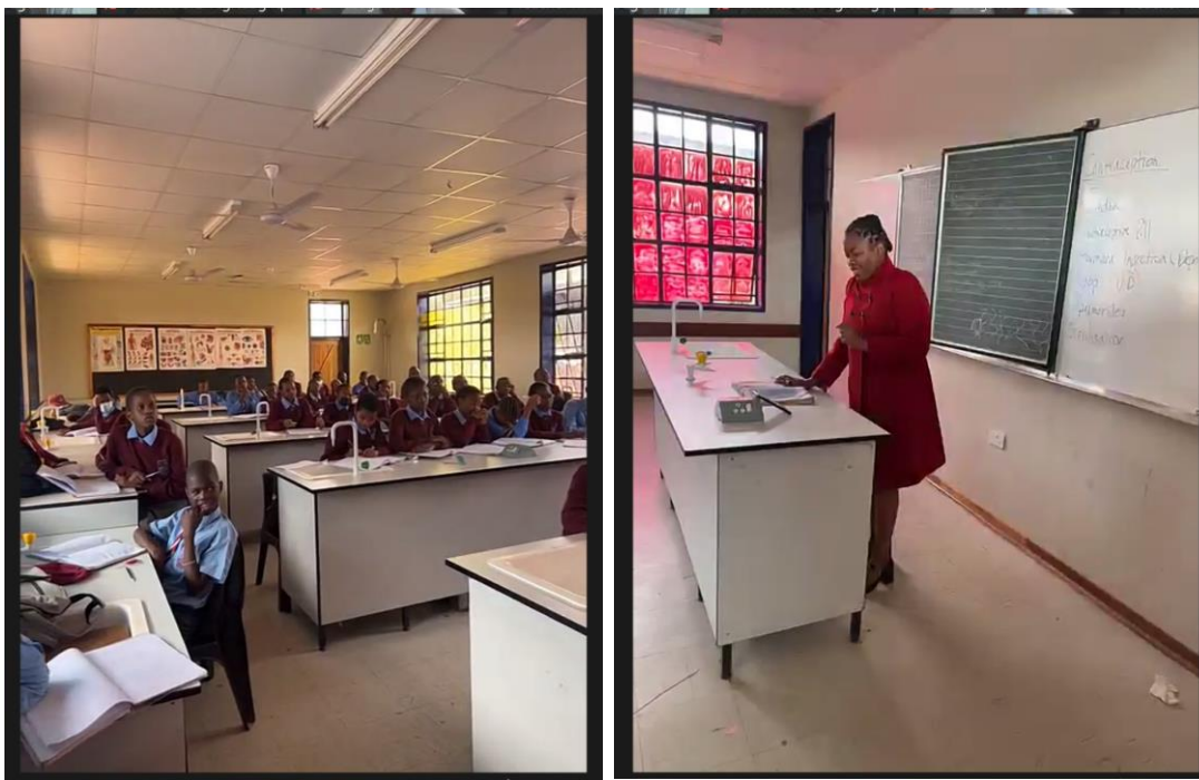
写真4 理科の授業風景、左の写真は生徒、右の写真は先生

Photograph 3, moving inside the school, sightseen in the campus can be seen.